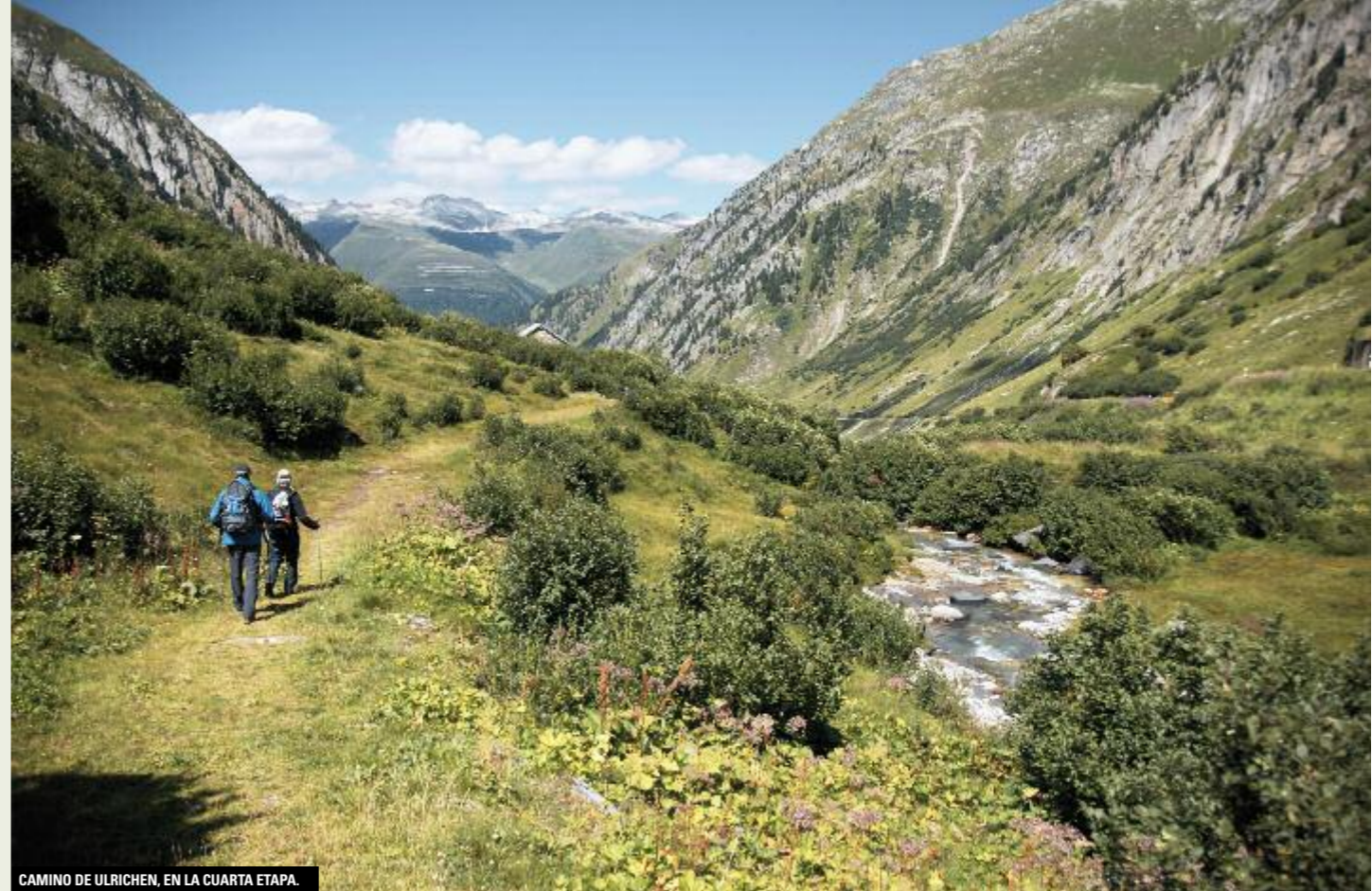
CAMINO DE ULRICHEN, EN LA CUARTA ETAPA.

subir una corta pero empinada cuesta para llegar a la cabaña Vermigel. ETAPA 2 C. VERMIGEL - PASO DE SAN GOTARDO (GOTTHARDPASS) DISTANCIA: 13 km. TIEMPO: 5 h 15 min. DESNIVEL: 1.050 m de subida y 1.000 de bajada. DIFICULTAD: T2/T3 según la clasificación del Club Alpino Suizo. RUTA: Cabaña Vermigel - Verborgene Plangge