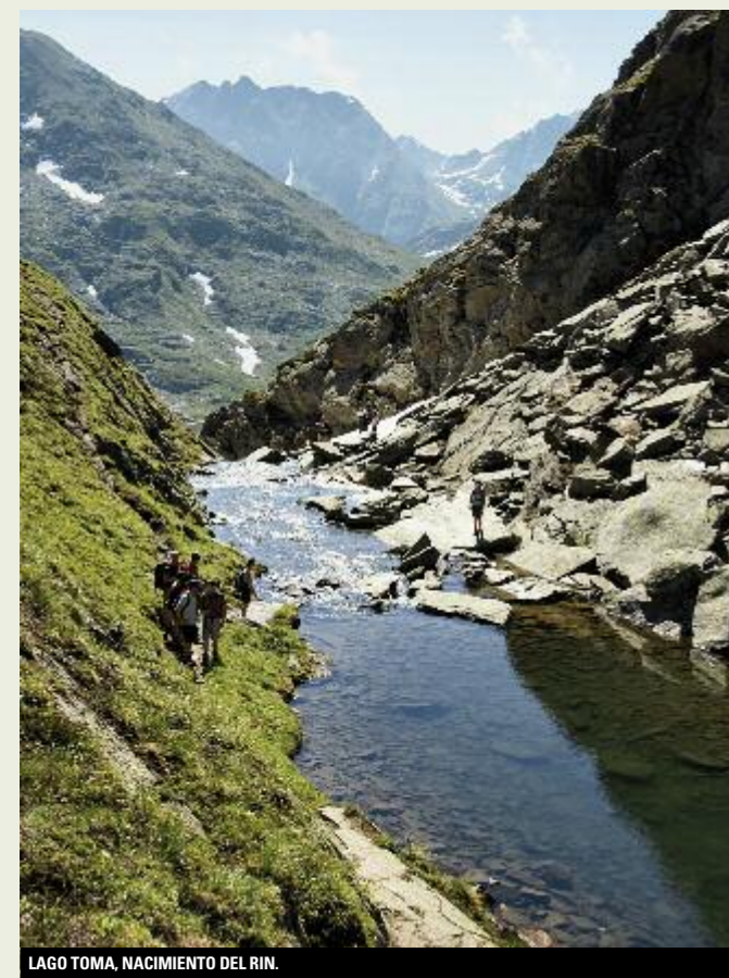
LAGO TOMA, NACIMIENTO DEL RIN.

Damos comienzo en el paso Oberalp donde las características señales amarillas de los senderos suizos indican el camino del lago Toma (al mismo lago se puede llegar siguiendo la ruta del pico Pazolastock pero es una alternativa más larga y deportiva). Después de un corto tramo cuesta arriba, el camino flanquea el Pazolastock.