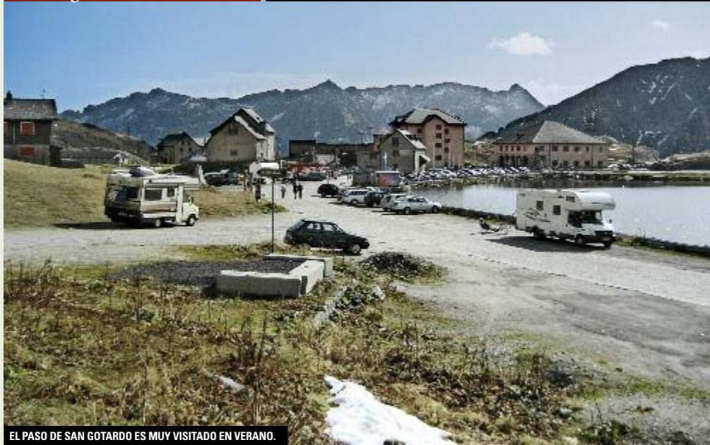
EL PASO DE SAN GOTARDO ES MUY VISITADO EN VERANO.

dro, pasando por unas instalaciones militares. Llegamos a un cruce. Un sendero sigue recto y después asciende por las faldas del Fibbia. Nosotros seguimos por la senda más empinada para encontrarnos con el Sentiero Alto Bedretto , también llamado Strada degli Alpi .