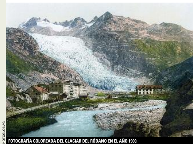
FOTOGRAFÍA COLOREADA DEL GLACIAR DEL RÓDANO EN EL AÑO 1900.

Por su fácil acceso, la evolución del glaciar del Ródano se viene observando desde el siglo XIX, y por eso se sabe con certeza que ha perdido mil trescientos metros durante los últimos ciento veinte años. Los glaciólogos han calculado que en el 2060 habrá reducido su extensión a la mitad de la actual. En 1850, durante la llamada Pequeña Edad de Hielo, el glaciar alcanzó casi a Gletsch, como puede verse en algunas pinturas y grabados de la época. Desde el hotel Belvedere parte un corto camino que se introduce en las entrañas del glaciar por medio de una galería excavada en el hielo. La entrada cuesta unos 50 céntimos de euro por persona. La superficie del hielo por encima del túnel está protegido por unas mantas térmicas para evitar que el hielo se funda. ■