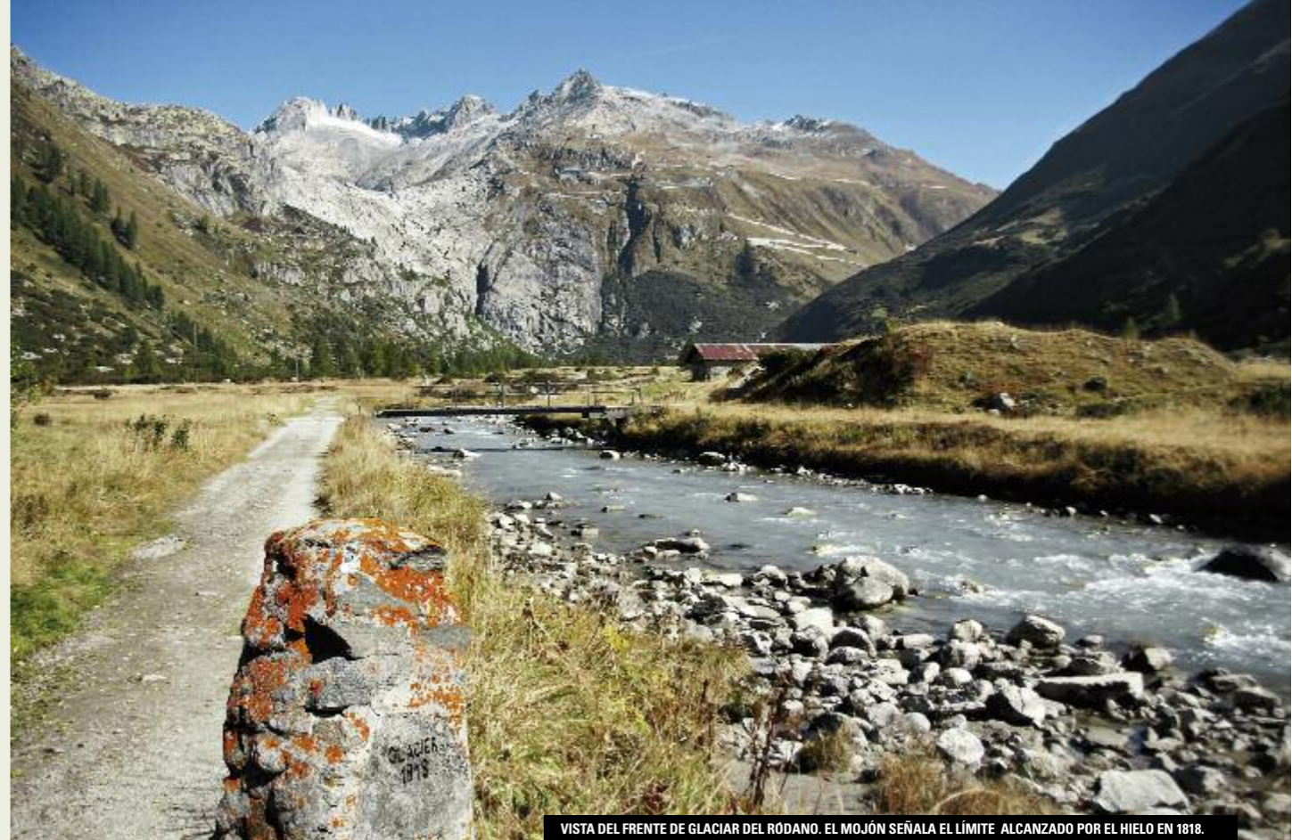
VISTA DEL FRENTE DE GLACIAR DEL RÓDANO. EL MOJÓN SEÑALA EL LÍMITE ALCANZADO POR EL HIELO EN 1818.