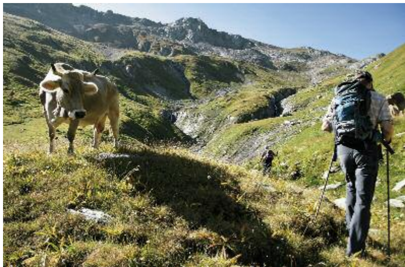
Arriba, inicio del segundo día de marcha rumbo al Paso Sella que se ve al fondo. Debajo, el antiguo tren de vapor del Furka todavía sigue traqueteando por el valle de Goms gracias al interés de un grupo de apasionados de este ingenio.

L OS Alpes leponinos son una sección del gran sector Alpes del Noroeste, que se despliegan al sur de Suiza, en la frontera con Italia. Se encuentran en la parte central de los Alpes, ocupando un territorio que abarca los cantones suizos de Valais, Tesino y Grisonas, y el Piamonte italiano. Su pico más alto es el Monte Leone, con 3.552 metros de altitud. Esta parte de los Alpes es conocida mundialmente por el paso de San Gotardo, un puerto situado a 2.109 metros de altitud que ha sido, desde tiempos inmemoriales, un punto neurálgico en las comunicaciones entre ambas vertientes de los Alpes.