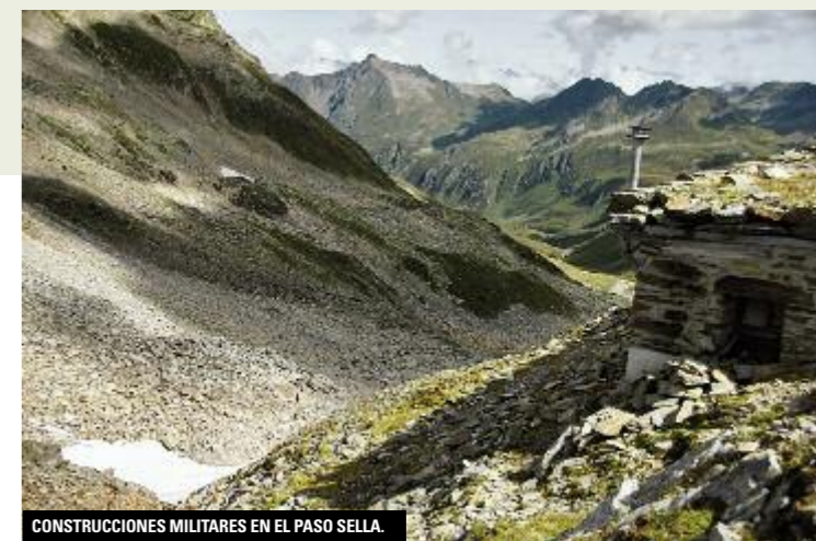
CONSTRUCCIONES MILITARES EN EL PASO SELLA.

En el cantón de Graubünden se hablan cinco dialectos del Retorromance o Romanche, un idioma de origen latino. Para evitar problemas de comunicación en los trámites burocráticos se usa un dialecto estándar llamado Rumantsch Grishun o Romansch de Graudunben. En el camino que va desde el paso de Oberalp al Paso Maighel, es preciso aprender algunas palabras de sursilvan: plaunca (cuesta o flanco), piogn (puentes), trutg (camino de montaña), y crap (roca o peñasco). ■